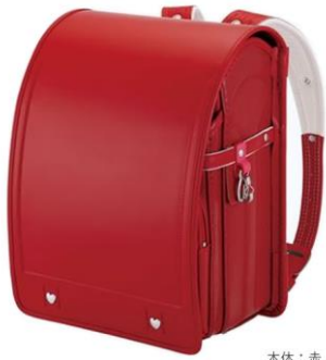
本体：赤 ステッチ色：赤